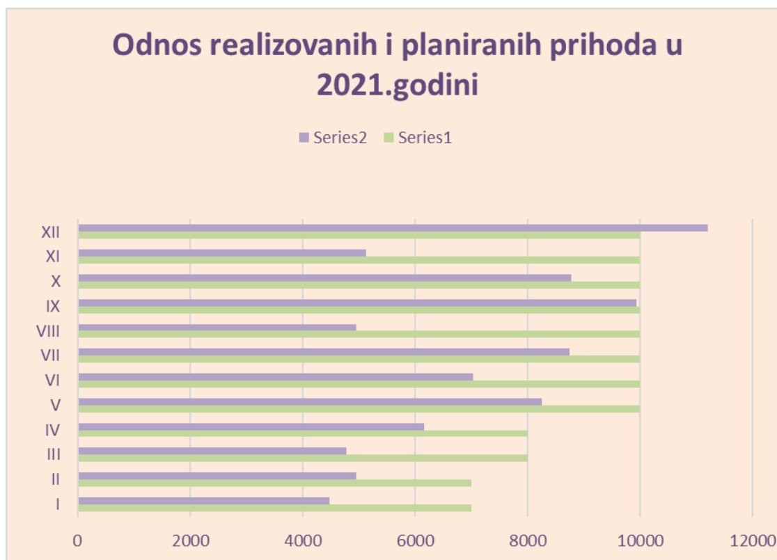
Grafikon 1: Odnos planiranih i realizovanih prihoda u 2021.godini

Protekla poslovna godina protekla je u izuzetno nepovoljnim uslovima za marketinško poslovanje. Problemi u poslovanju vezani su za opšte uslove privređivanja a posebno za turističku privredu kao dominantan oblik poslovanja u našoj sredini, koja je između ostalog sezonskog karaktera. Prihodi ostvareni prodajom sopstvenih usluga u 2021. godini iznose 84.371,31€ (neto realizacija) što iznosi 79 % planiranog.